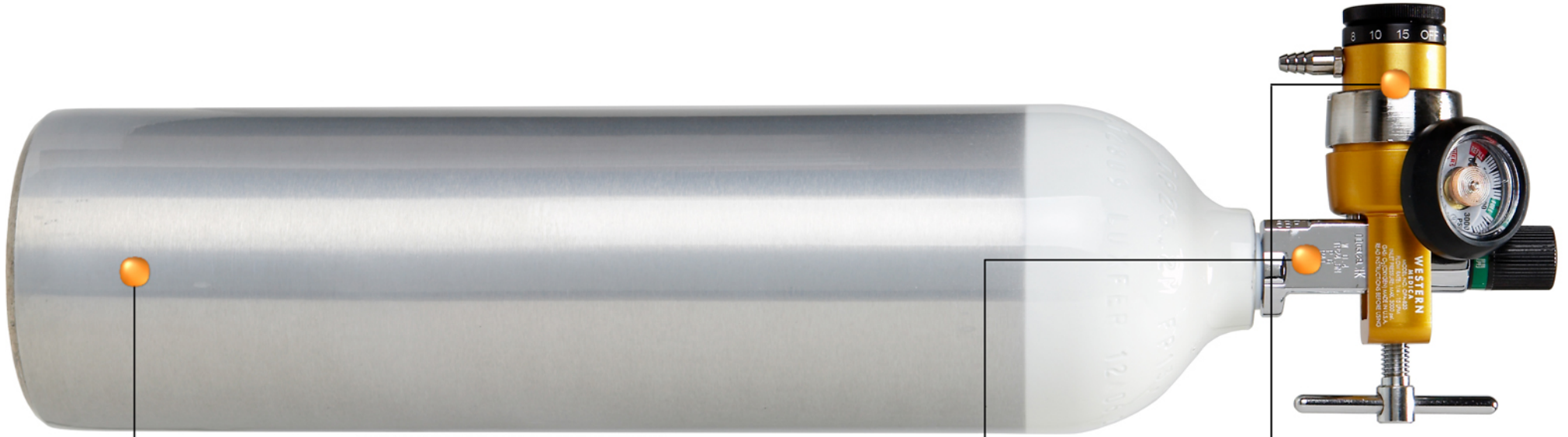
본 제품은 오투케어 300과 산소조절기 OPA-830 장착 사진입니다