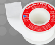
테 프 론