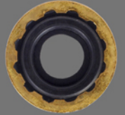
Regulator O 링