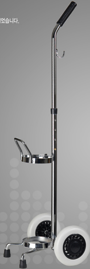
카트 (Cart) 적용모델: 오투케어500