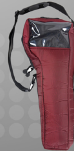
가방 (Bag) 적용모델: 오투케어300