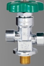
O 2 Value (영도산업)